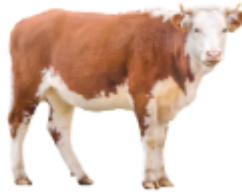
ثور: بُول - Bull