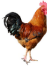
ديك: كُوْكَ - Cock