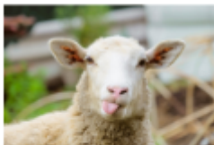
خروف: شِيپ - Sheep