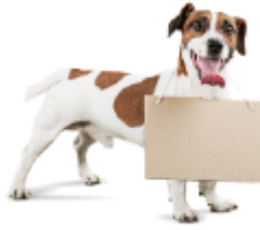
كلب: دُوغ - Dog