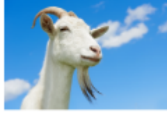
معزة: جُوْث - Goat