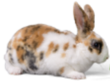
أرنب: رَابِيْت - Rabbit