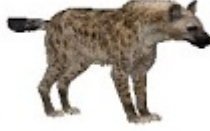
جاموس بُوقلو بيسن – Buffalo-bison