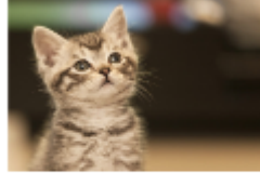
قط صغير Kitten