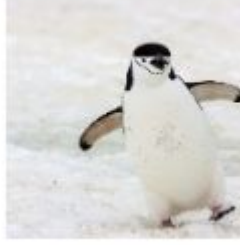
البط: ذاك – Duck