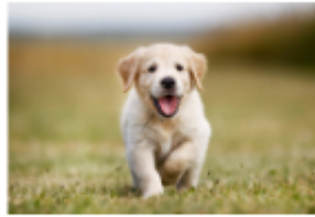
جرو: پُوبي - Puppy