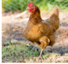
دجاجة: نُشِيكِرُنْ - Chicken