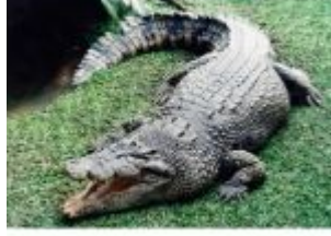
زرافة: جِيرافُ – Giraffe